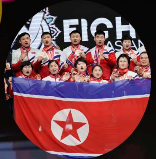
"The ranking of the top five positions."